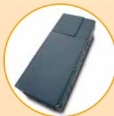
Basissteuerung mit Erweiterung, MP 155

Speziell für Tiefgaragen mit bis zu 100 Stellplätzen und Industrietore bietet die MP-Serie von TBS vier Modelle mit besonders strapazierfähigem Zahnriemen und vielen Zusatzfunktionen, z.B. einem automatischen Zulauf. Alle Modelle verfügen über eine maximale Zug-/Druckkraft von 1.200 N und sind wartungsfrei und laufruhig.