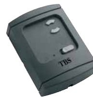
Funk-Innentaster BHS 421