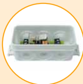
Zusatzplatine, MP 140

Für Industrietore und Tiefgaragen bis 100 Stellplätze. Für Rotampelanschluss. Separates Steuerungsgehäuse für diverse weitere Funktionen.