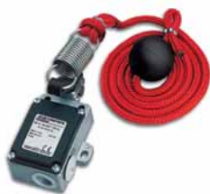
Zugtaster mit Seil