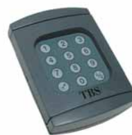
Funk-Codetaster BHS 591