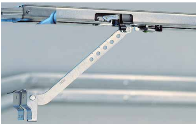
Selbst justierender Zahngurt und patentierte Aufschiebesicherung gegen unbefugtes Öffnen serienmäßig.