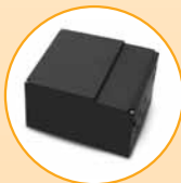
Zusatzsteuerung Rot/Grün, MP 150

Für Industrietore und Tiefgaragen bis 100 Stellplätze. Mit separater Basissteuerung und Ampelkarte im Erweiterungsgehäuse als Gegenverkehrssteuerung ausgelegt.