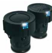
BHS 211, BHS 221