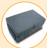
Steuerung, MP 145