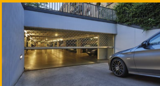
Rollgitter für eine Tiefgarageneinfahrt.