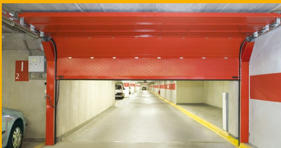
Brandschutztor in einer öffentlichen Tiefgarage.