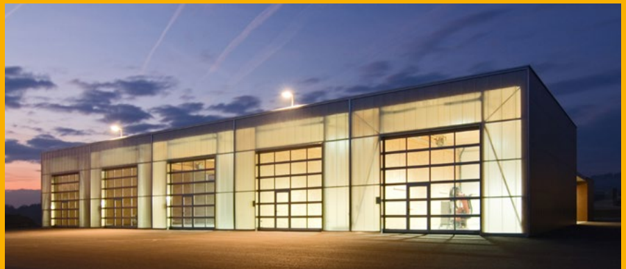
Industriesektionaltore mit integrierter Schlupftür.