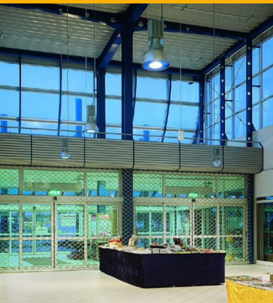
Einzelhandelsgeschäft mit Rollgitter.

Ob Verkaufsgeschäft, Lagerhalle, Feuerwehrrache, Autowaschstraße, Multifunktionsarena, Produktionshalle, private oder öffentliche Tiefgaragen. Wir sorgen für eine sichere und langlebige Nutzung ihrer Türen und Tore.