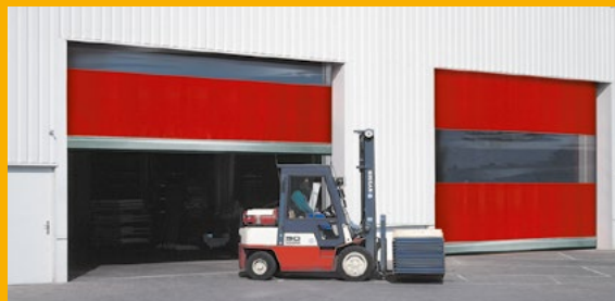
Lagerhalle mit Schnellauftoren.