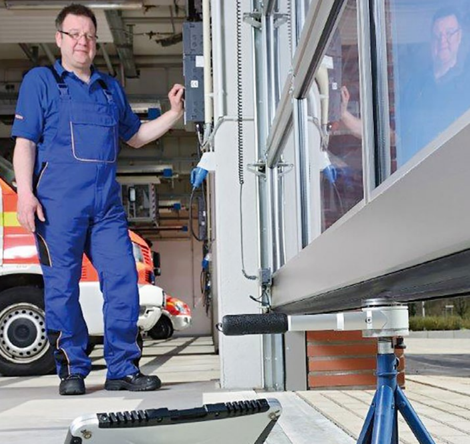
Kraftmessung eines Industriegesektionaltors.