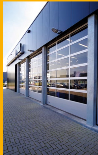
Autowerkstatt mit verglasten Industriesektionaltoren.