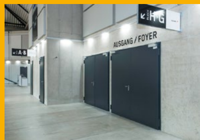
2-flügelige Feuerschutztüren in einer Multifunktionsarena.