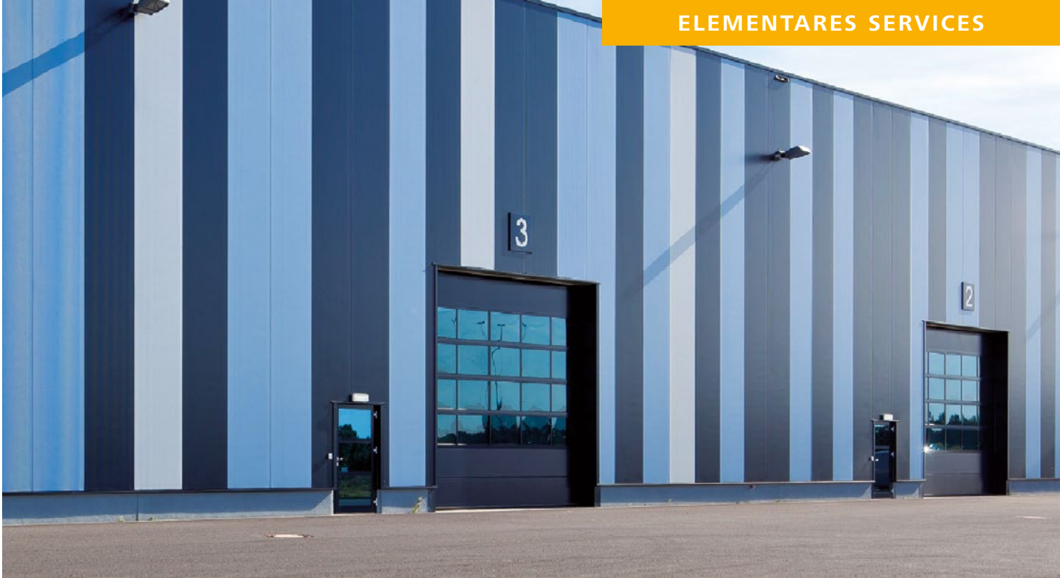
Kraftbetätigte Türen und Tore müssen jährlich überprüft werden.

„Wir stellen sicher, dass Ihre Türen und Tore problemlos funktionieren. Tag für Tag.“