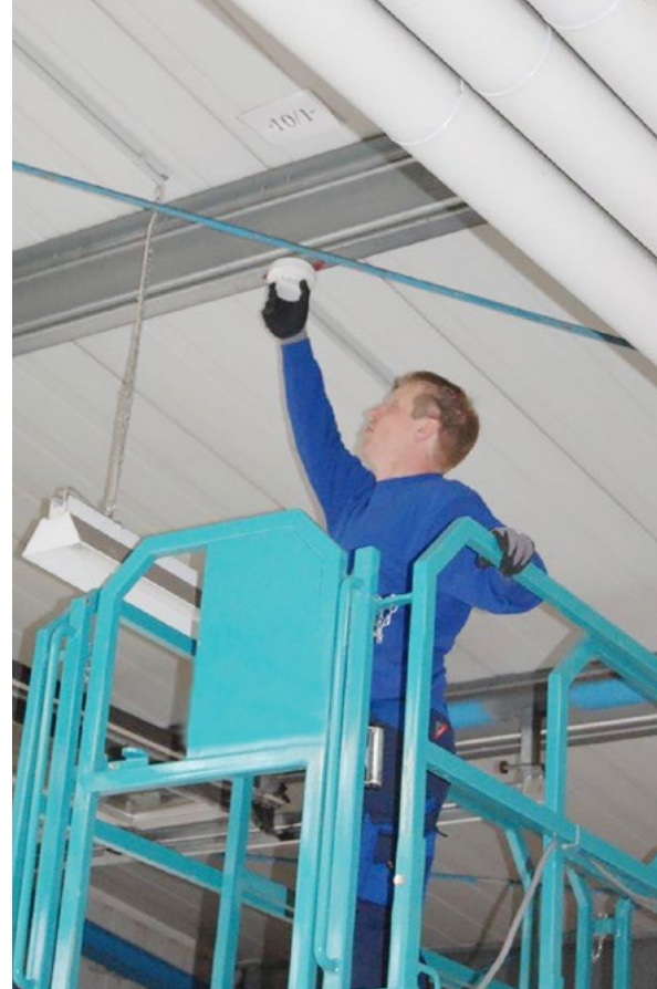
Überprüfung eines Rauchmelders.

„Vertrauen ist gut. Kontrolle ist unverzichtbar.“